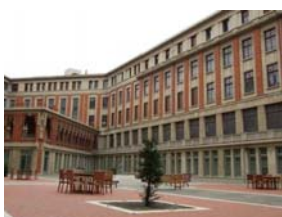
ARGARAY 医療視察② (高齢者福祉施設) 他に OBLATAS, IBANETA

1997年に設立したアマ・グループは、スペイン国内の高齢者福祉施設として2001年に初のISO9001を取得。また、国内のみならず、ヨーロッパ内でも数々の表彰を受けている民間企業です。国内7地域に、計30の高齢者センターを有し、5,300床と2,500人の職員スタッフがいます。施設デザインの専門家と技術者たちで構成されるアマ・グループでは、地域社会で認知され全国展開を図る一方、医療・看護・リハ・ソーシャルワーカーのみならず、家族や子どもも含めた”カスタムケア”と呼ばれる独自のサービスがエキスパートにより、提供されています。