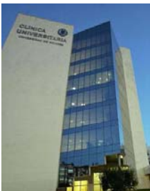
ナバラ大学病院 医療視察①

パンブローナでは、最大規模の小児科病棟、産科病棟のある重要な病院です。1954年に医学部、看護学部が設立。特に小児悪性骨腫瘍の研究と、神経科医や心理学者の専門家チームで構成された小児神経の研究が行われています。予定として、新生児期の発達障害、睡眠障害における支援の取り組みやレスパイトケアについて視察を考慮しております。