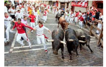
有名なパンブローナの牛追い祭り (7月)

OP=オプション AF= エールフランス ※急患など医療施設の急な事情により、訪問日や視察内容・視察先が変更になることもありますので予めご了承願います。