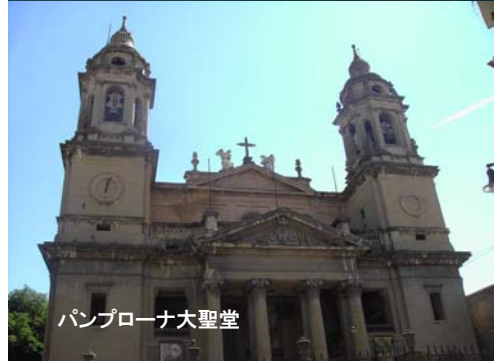
パンプローナ大聖堂

グルマンを喰らせる食通の街サン・セバスチャン。スペイン全土にある3ツ星レストラン5店のうち、2店がこの小さなビーチリゾートに存在する。